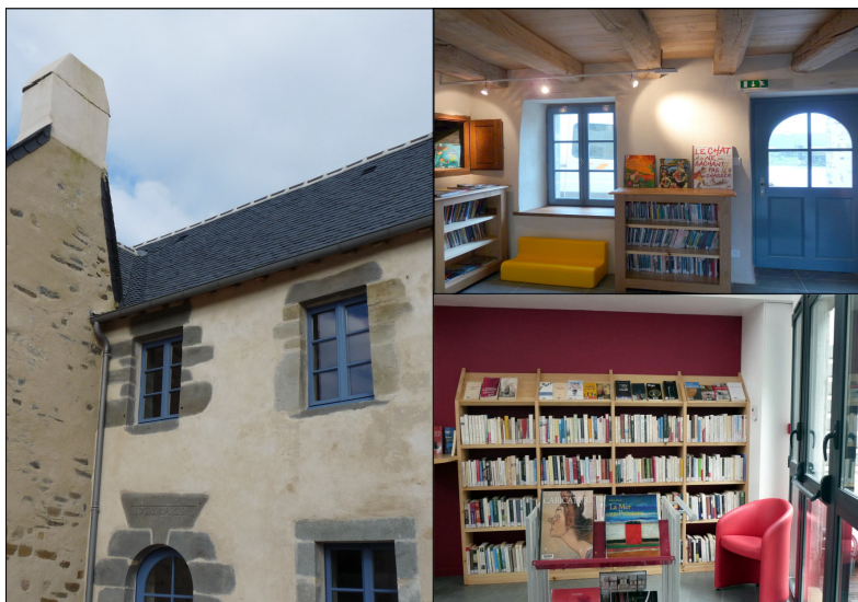
La nouvelle bibliothèque s'est installée dans la maison Herry.