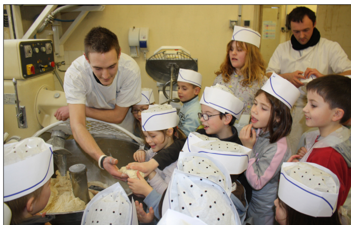
Des vocations en train de naître ?