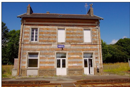
La gare, sur la voie ferrée qui séparerait la commune de Hanvec.

L'association Nature et Patrimoine du pays de Hanvec prépare depuis quelques mois une