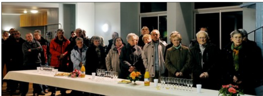
Les hanvécois, attentifs au discours de Mme le Maire.

Vous étiez venus nombreux vendredi 22 janvier, assister aux vœux du maire qui ouvrent traditionnellement la nouvelle année. Retour sur les grands points du discours.