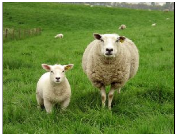
Pensez à nous identifier !

Ovins et caprins peuvent être affectés par différentes maladies contagieuses, dont certaines sont transmissibles aux bovins et à l'homme. Dans cette optique, quelques précautions sont à prendre. Tout d'abord, l'éleveur doit choisir un vétérinaire, et le déclarer à la Direction Départementale des Services Vétérinaires du Finistère (DDSV29). Celui-ci se chargera du dépistage à