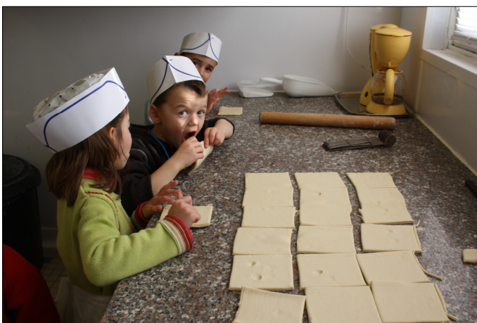
Pris sur le fait !