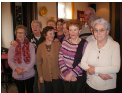
Le repas des serveuses.

L'Amicale des retraités de Hanvec vient de renouveler son bureau. À cette occasion, le nouveau prési-