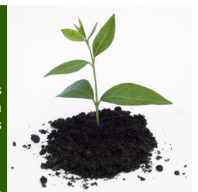
Un geste économique et écologique.

Oui, il faut éviter de jeter au compost certaines mauvaises herbes, surtout celles porteuses de graines car elles peuvent favoriser leur prolifération. N'utilisez pas non plus les déchets ayant subi un traitement chimique comme les désherbants, pesticides, fongicides et autres produits néfastes pour l'environnement. Mais aussi : plantes malades, viande, os, poisson, notamment les arêtes, huîtres, moules, produits laitiers, pelures d'orange, de citron ou de pamplemousse.