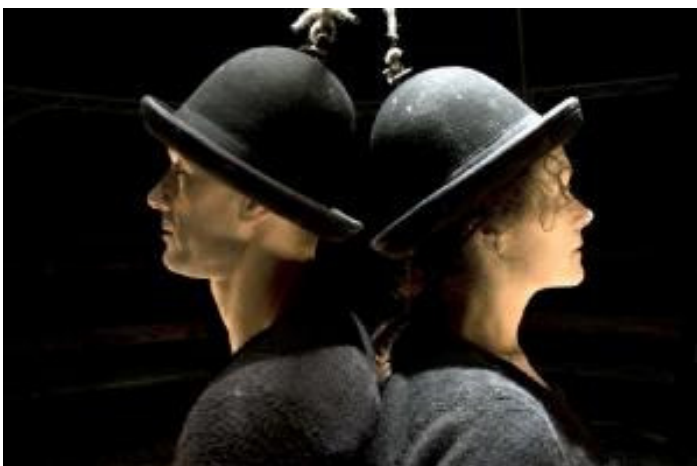
« 2 », Compagnie Le P'tit Cirk, mardi et mercredi sous le chapiteau de l'Esplanade du Family