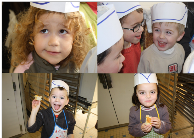
Des petits boulangers heu-reux !!