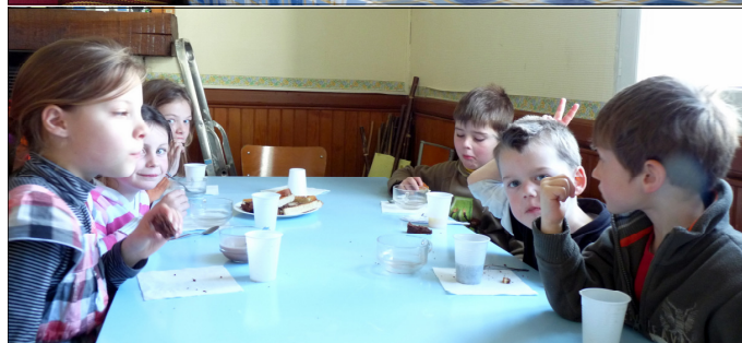
Le goûter, dans la joie et la bonne humeur!