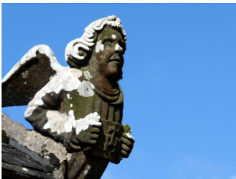
Détail de l'ossuaire

Pour découvrir tous les trésors patrimoniaux de Hanvec, des randonnées seront proposées en partenariat avec Dimerc'her. Les visiteurs pourront suivre un des parcours proposés ou se concocter leur propre itinéraire, suivant les édifices qu'ils ont envie de voir. Les principaux monuments du bourg seront ouverts au public de 10h à 17h et deux conférences seront proposées au public. Tout au long de la journée, une projection présentant tous les monuments de la commune tournera en boucle salle Paulette Perrier, à la Mairie. Enfin, un goûter sera offert salle polyvalente aux randonneurs qui l'auront bien mérité! (mais aussi aux autres, bien entendu).