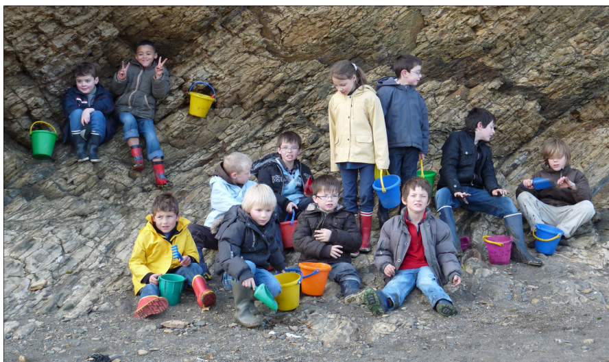
Photo de groupe.