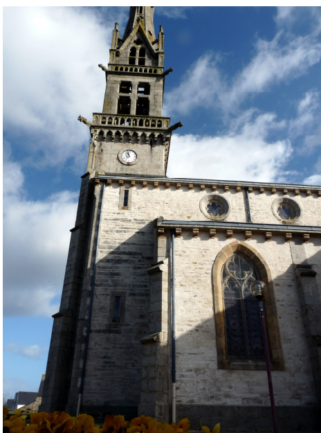
L'Eglise St Pierre