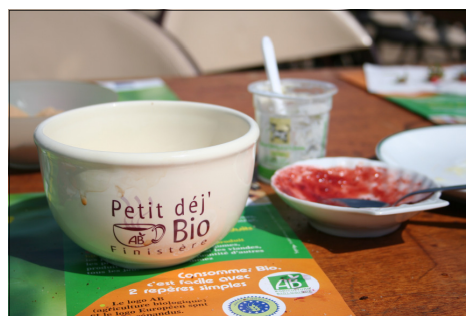
À la découverte produits bios!