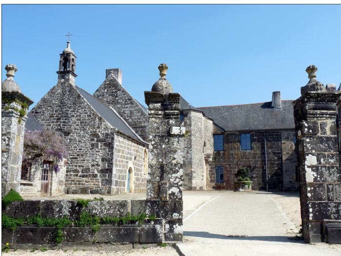
Le manoir de Kerliver, XVI e siècle.

Contrairement à l'édition 2009 à Lanvéoc, pas de balade en bateau mais une initiation à la marche nordique, cette marche accélérée qui se pratique armé de bâtons de marche spécifiques. Cette dérive du ski de fond et de la marche athlétique , extrêmement populaire dans les pays scandinaves, se pratique été comme hiver. Un moniteur de la FFR (fédération française de randonnée) mettra à disposition du public paires de bâtons et conseils avisés.