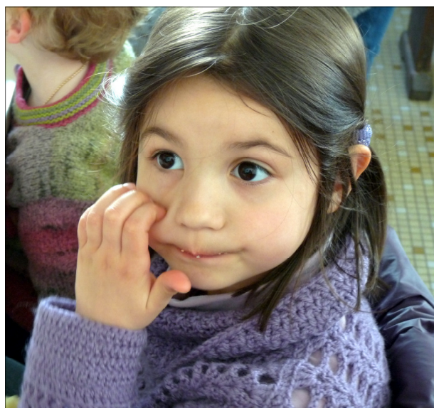
Mmm... les bons gâteaux!