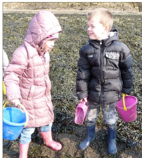
Fais voir ce qu'il y a dans ton seau?