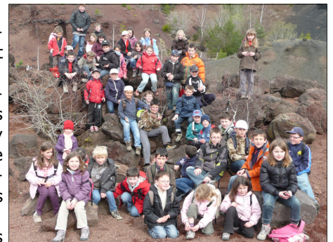
La classe au grand complet

Nous sommes partis en car le soir du dimanche 4 avril. Le lundi matin, nous sommes arrivés à la « Roche des fées » (à la Bourboule). Après le petit déjeuner, nous avons fait une lecture de paysage et l'après-midi nous sommes montés en télécabine au plateau de Charlanne. Durant cette semaine, nous avons visité et goûté les sources de la Bourboule : certaines étaient chaudes ou avaient un goût de fer, d'autres étaient pétillantes... Nous sommes aussi montés au Puy Pariou et au Puy de la vache. Nous avons visité le château de Murol, une ferme productrice de Saint Nectaire, la vallée Chaudefour et le musée de la Toinette et Julien. Un soir, Rodolphe, un conteur, est venu nous raconter des légendes d'Auvergne. Le samedi 10 au matin, à 7h00, nous étions de retour, fatigués mais très contents de notre voyage.