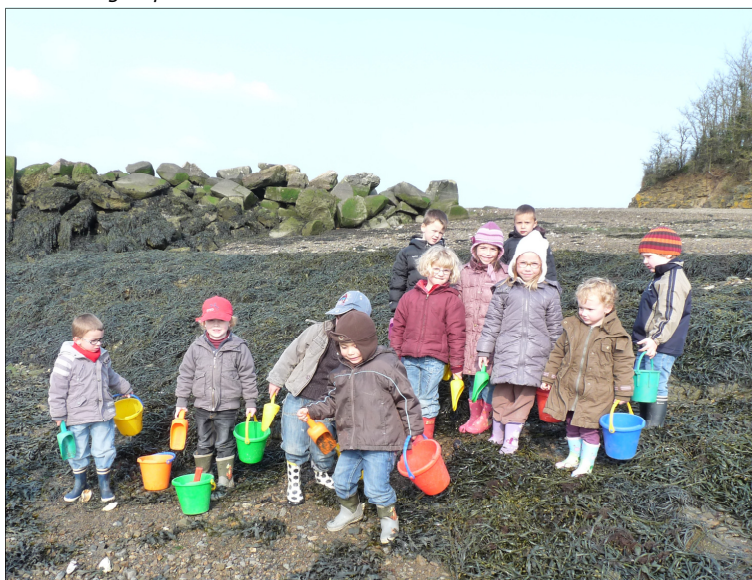
Bottes, seaux, pelles... parés pour la pêche à pied!