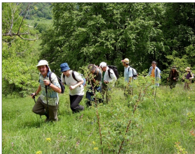
En famille ou entre amis, profiter de la nature, tout simplement.

sage jaune (sentier du littoral) sinon le GR vous emmène à Daoulas (très joli aussi mais beaucoup plus long!). Ce parcours ne contient aucune difficulté particulière, on peut le suivre de façon sportive ou en famille, plus tranquillement... Les plus athlétiques, eux, s'aventureront plutôt du côté du chemin de la déchetterie