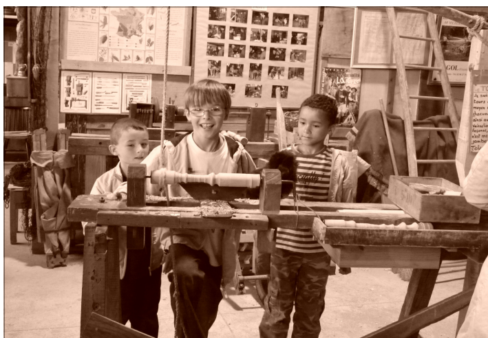
Les enfants ont découvert avec grand intérêt le musée des vieux métiers à Argol, la fabrication des sabots et des tissus avec la laine des moutons. Chacun est reparti avec un cadeau tout doux et odorant ...