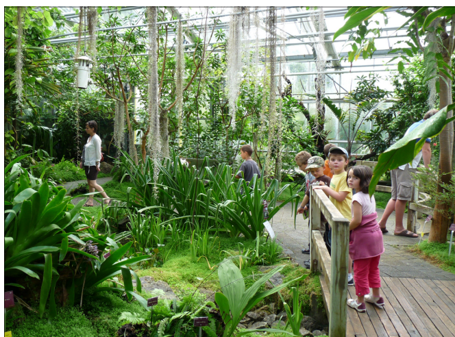
Au jardin botanique de Brest, les enfants ont cherché un trésor, caché au pied de l'arbre!