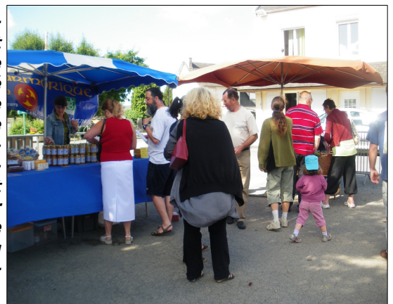
Marché bio du 7 juillet 2010

Les Hanvécois sont venus faire leur marché en musique le matin avec le groupe Hastafu. L'après-midi, ils ont pu applaudir le cercle de Landerneau et « Les Lougriers ».