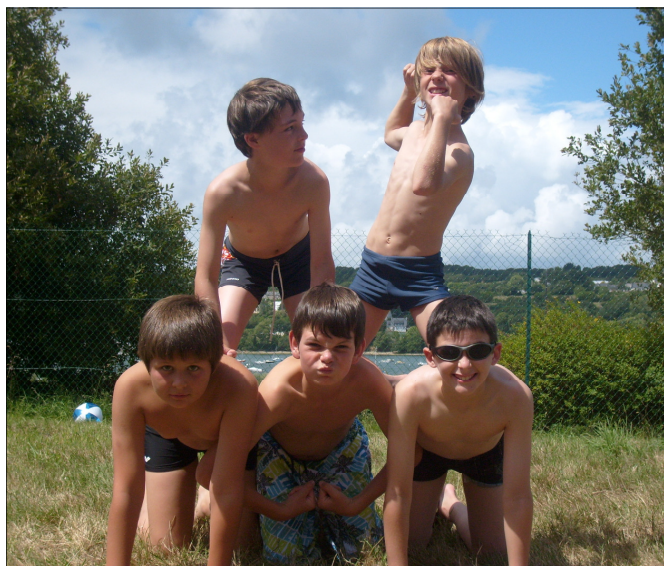
Montagne de muscles !