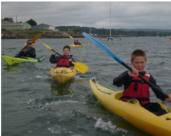
Sortie kayak, pendant le mini-camp.

Petit aperçu, en images, d'un été au centre de loisirs de Hanvec.