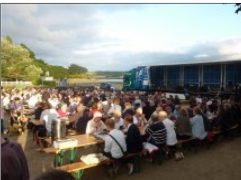
Le repas du pêcheur organisé par l'ES Cranou a réuni 320 personnes dans une ambiance chaleureuse et conviviale. Cette soirée animée par le groupe BLOWENN de Saint Urbain a permis aux convives de pousser la chansonnette ou de jouer de leur instrument favori.

Dans le cadre des veillées du Parc Naturel régional d'Armorique, l'église de Hanvec a ouvert ses portes samedi 21 août à un duo pour un concert. Pendant une heure un quart, estivants et population locale ont écouté Ysa, harpiste chanteuse accompagnée d'Olivier