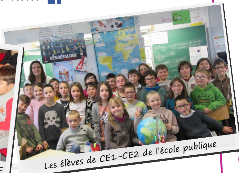
Les élèves de CE1-CE2 de l'école publique