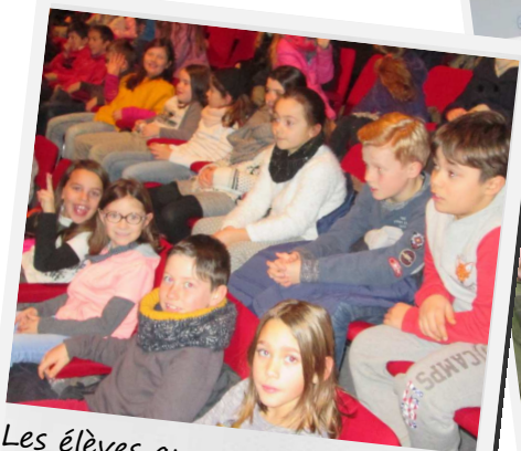
Les élèves au spectacle des JMF

Les élèves de l'école Per-Jakez-Helias de CE1-CE2 et de CM1-CM2 ont assisté à leur 2 nd spectacle des Jeunesses Musicales de France au Family à Landerneau intitulé Caravelle. Une plongée musicale contée au cœur du voyage de Vasco de Gamma vers les Indes. Les enfants ont pu suivre ce fantastique voyage en caravelle avec la guitare, l'accordéon, la sanza et les tablas indiennes.