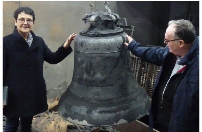
Démoulage de Jeanne Yvonne avec Mme Le Maire et M le curé