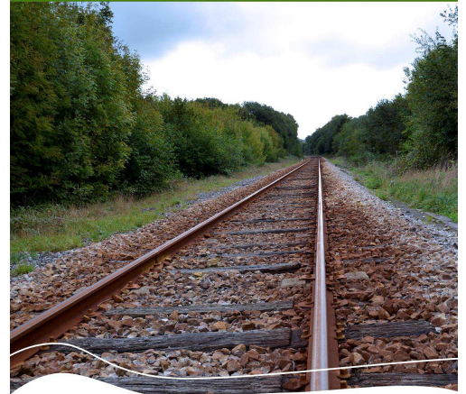
Dossier p.3 Le personnel communal

Bimestriel de la commune de Hanvec Mars-Avril 2017 n°306