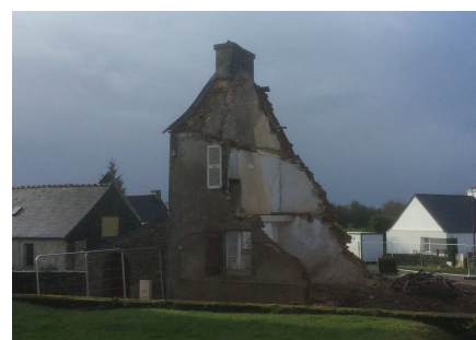
Démolition rue du Musée

Comme vous l'avez sûrement remarqué, la démolition a commencé rue du Musée. Cela va permettre à la Maison de Santé de Hanvec de sortir de terre au cours du premier semestre, pour une réception du bâtiment durant l'été. Le deuxième gros chantier de l'année à venir concernera le projet d'aménagement et de sécurisation de la route de la gare. La commune a également pour projet de faire construire des vestiaires près du terrain de football. Enfin, une aire de covoiturage sera aménagée par le conseil départemental à la place de l'ancienne station essence et devrait voir le jour au deuxième semestre. Elle comportera 29 places de stationnement. Enfin, cette année sera aussi celle de la réflexion autour la deuxième tranche de travaux d'aménagement du centre bourg. Autre événement sur le territoire de notre commune, l'inauguration des nouveaux bâtiments du domaine de Menez-Meur.