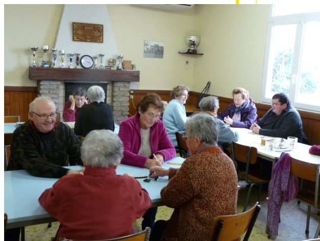
Parties de domino au Club Temps Libre

Pour plus de renseignements, vous pouvez vous adresser à Philippe Guillou au 02 90 82 05 98 ou à Berthe Autret au 02 98 21 91 07.